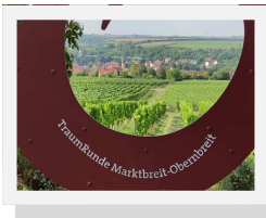
Die Traumrunde beginnt

Endlich ist es wieder soweit! Nach unser Wanderung im Mai zieht es uns dieses Mal nach Marktbreit.